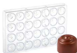
Форма для шоколада, 28 шт.

Н 2,6 см; L 27,5 см; В 17,5 см поликарбонат, прозрач.