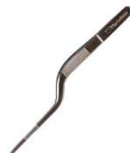
Пинцет кухонный изогнутый