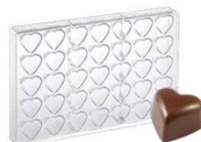
Форма для шоколада «Сердце», 35 шт.

Н 2,6 см; L 27,5 см; В 17,5 см поликарбонат, прозрач.