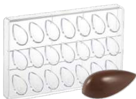
Форма для шоколада «Капля», 21 шт.

Н 2,6 см; L 27,5 см; В 17,5 см поликарбонат, прозрач.