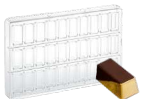
Форма для шоколада, 30 шт.

Н 2,6 см; L 27,5 см; В 17,5 см поликарбонат, прозрач.