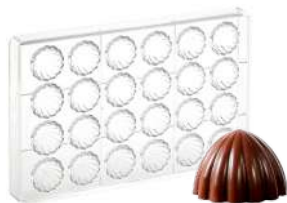
Форма для шоколада «Свит 2», 24 шт.

Н 2,6 см; L 27,5 см; В 17,5 см поликарбонат, прозрач.