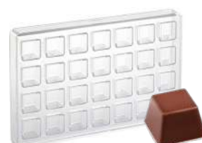
Форма для шоколада, 28 шт.

Н 2,6 см; L 27,5 см; В 17,5 см поликарбонат, прозрач.