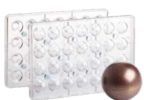
Форма для шоколада «Трюфель 3D», 28 шт.

Н 3,1 см; L 27,5 см; В 17,5 см поликарбонат, прозрач.