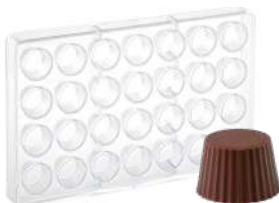
Форма для шоколада «Корзинка», 28 шт.

Н 2,6 см; L 27,5 см; В 17,5 см поликарбонат, прозрач.