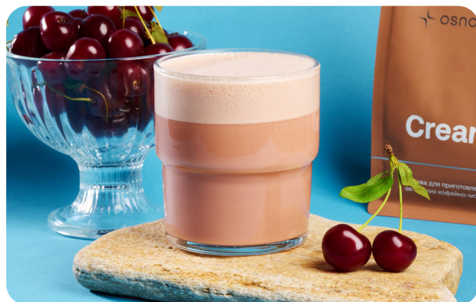
Панакота с вишней

Нежное сочетание красной малины сорта «патриция» и жёлтой «амбер» с кокосовой мякотью и цитрусовыми нотами на послевкусии. Ягоды придают свежесть, кокос — мягкость; создаётся воздушный, сладко-ягодный букет, идеально гармонирующий с кофейной основой.