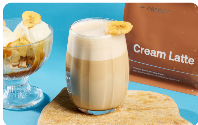
Банановое мороженое с солёной карамелью

Сочетание сочного, сладкого мандарина с мягкими нотами свежеспечённого песочного печенья создаёт насыщенный, уютный вкус. Лёгкая цитрусовая кислинка уравновешена сливочно-бисквитной текстурой и тёплым ароматом ванили.